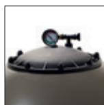
Large ouverture dessus pour faciliter la charge du sable