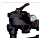
Vanne 6 positions avec manomètre intégré